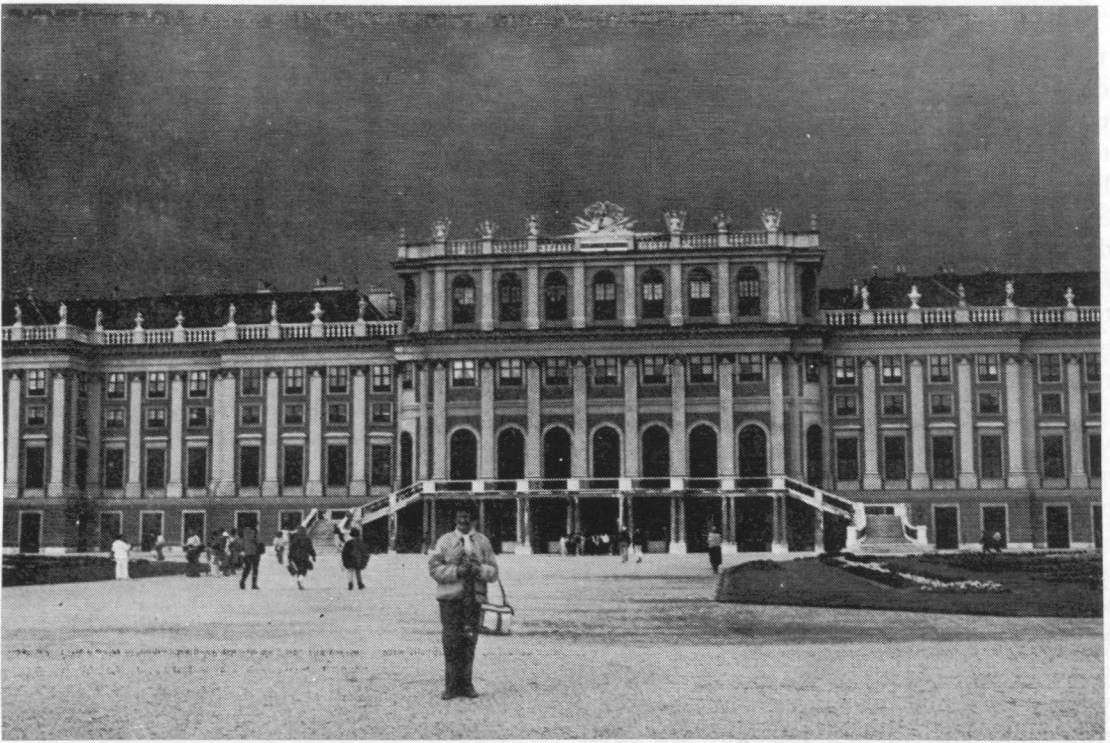
Viena. Schoenbrunn pilis.