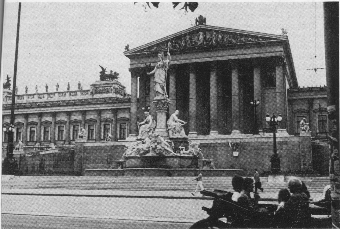
Viena. Parlamento rūmai ir Atenės statula.