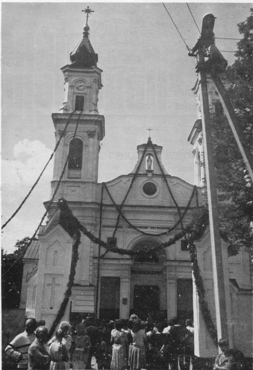
Marijampolės bažnyčia, papuošta iškilimams, perkeliant pal. Jurgio Matulaičio palaikus iš kriptos sienoje į altorių ir švenčiant krikščionybės 600 metų sukaktį.