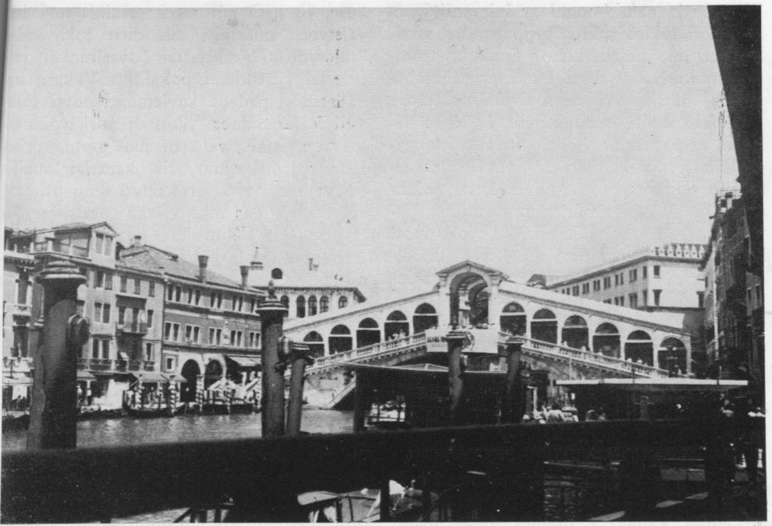
Venecija. Didysis kanalas ir Rialto tiltas.