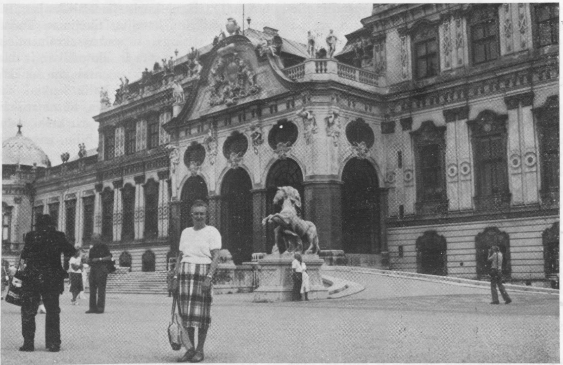
Viena. Belvedere rūmai.