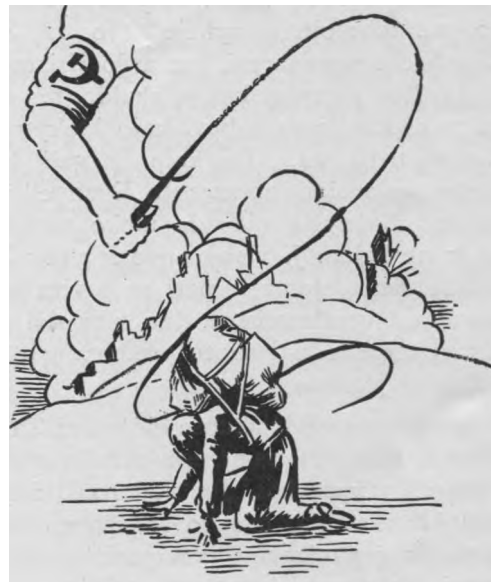
K e n č i a n t i L i e t u v a