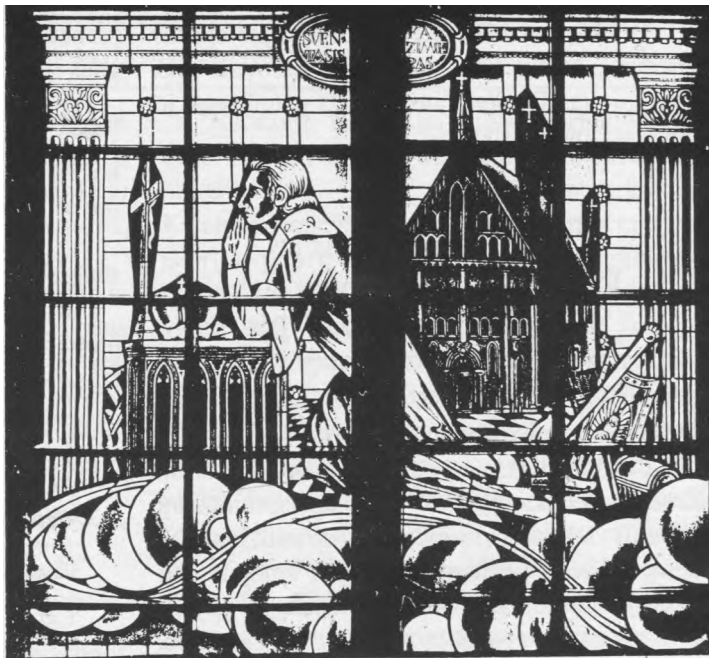
Vitražo, skirto šv. Kazimierui, fragmentas, 1991.

Didysis šventės akcentas — kovo 6 diena, sekmadienis. Į moksleivių ir jaunimo šv. Mišias