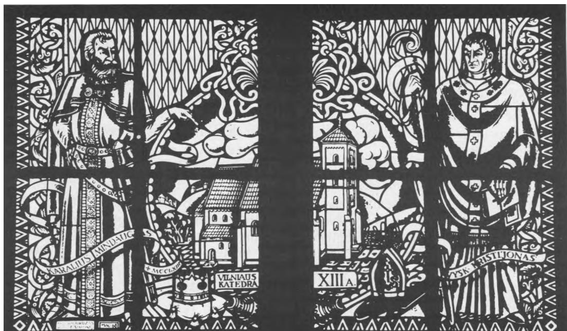
Vitražo, skirto pirmajai Vilniaus katedrai, fragmentas.