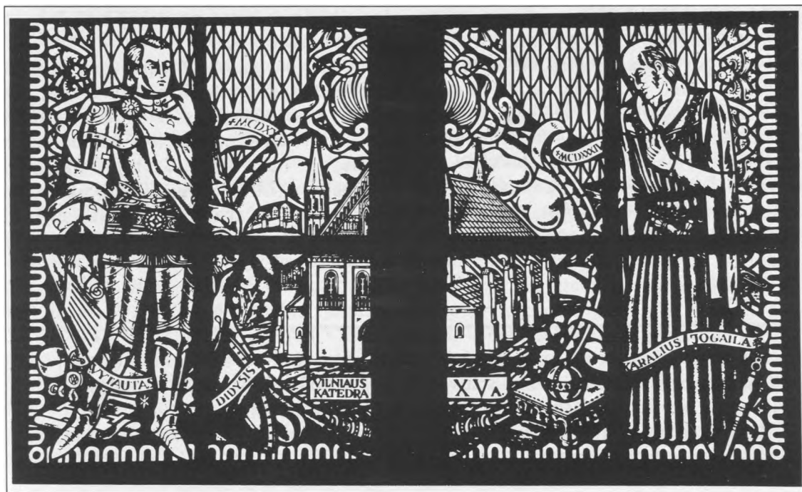
Vitražo, skirto Vytauto ir Jogailos laikų katedrai, fragmentas.

įtaigi plastinė kalba, mintys reiškiamos netiesmukiškai. Darbuose atsispindi tarpus asmenišką santykis su pasauliu bei filosofinės - religinės nuostatos. Tiek dideliuose estampuose, tiek mažojoje grafikoje juntamas realios aplinkos poetizavimas. Lyrinio vaizdavimo specifika nulemia retrospektyvių vaizdinių, įvairių detalių skaidymo, fragmentinių statinių bei peizažo vaizdų pomėgis. Piešimo grakščios grafinės linijos svarba visad išlieka. Žmonės, daiktai dažniausiai išlaiko natūralius pavidalus, tačiau jie akivaizdžiai susieti alegoriškais saitais. Hiperbolizuojant atskiras formas ar geometrinius kūnus, jie įgauna alegorinę prasmę. Neretai, ypač miniatiūros, vaizdas išnyra tarsi iš sapno. Minimaliomis priemonėmis — štrichu, grakščios linijos žaismu ar spalva dailininkė geba subtiliai perteikti būties dramatinį išgyvenimą, pasiekia norimos emocinės