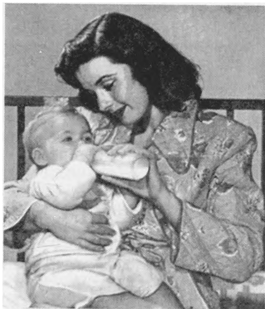
Motinos rūpestis: kažin kas iš šio mažylio užaugs?

Visais laikais mūsų šalyje inteligento pareiga buvo sergėti tautos kultūrą, puoselėti lietuviybę. Ypač tai aktualu dabar, kai kultūrinis gyvenimas Lietuvoje kasdien vis didėjančiu greičiu įgauna įmantresnes, greitai besikeičiančias formas. Kas gi formuoja kultūrą mūsų visuomenėje? Koks kultūros vaidmuo mūsų tautos savimonėje?